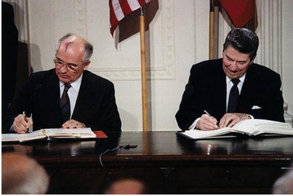
Mikhaïl Gorbatchev (à gauche), dirigeant de l'URSS et Ronald Reagan (à droite) président des États-Unis